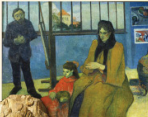
Henry Schuffenecker, Belleury Rue of Chateaugay, 1888 Cathedral Library, Aarhus, and Institute of The Art Index/The Picture Desk Inc.

This rich art image database, available exclusively on WilsonWeb, now offers more than 155,000 works from an impressive roster of distinguished international museum sources.