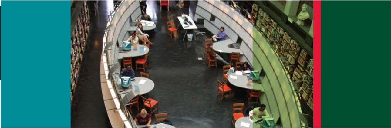
Photo: Oslo Public Library

International Federation of Library Associations and Institutions