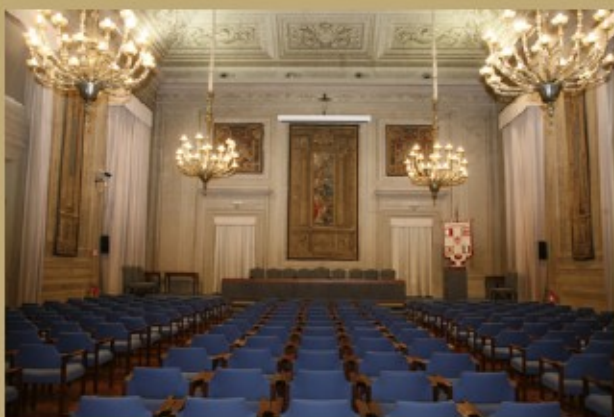
佛罗伦萨大学玛格纳礼堂 (Aula Magna of Florence University)